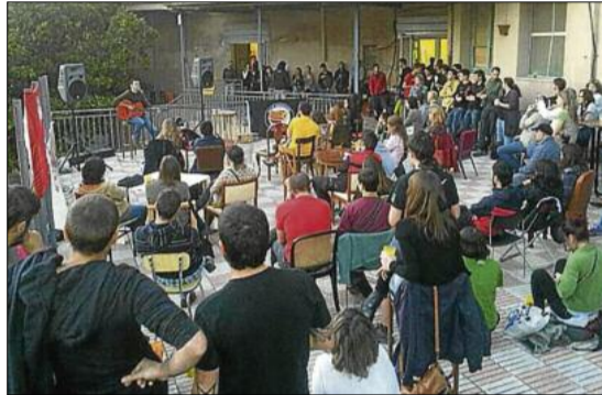
Concert de Feliu Ventura, celebrat aquest mes d'abril