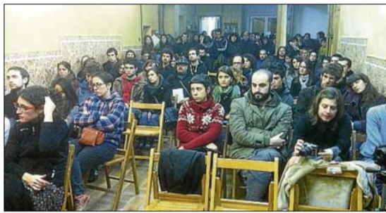
Xerrada de presentació de la PAHC Bages