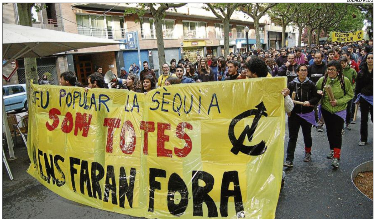
Més de 500 persones van recórrer el Passeig en protesta pel procés de desallotjament al qual s'enfronten

La manifestació va durar més de 90 minuts perquè el col·lectiu va anar fent diverses parades. Va destacar la de la plaça de Sant Domènec, on el col·lectiu va penjar una pancarta, de grans dimensions, a la façana del Conservatori amb el missatge: «La terra per a qui la treballa i els espais per als que els utilitzen. Ateneu popular la Sèquia per a totes».