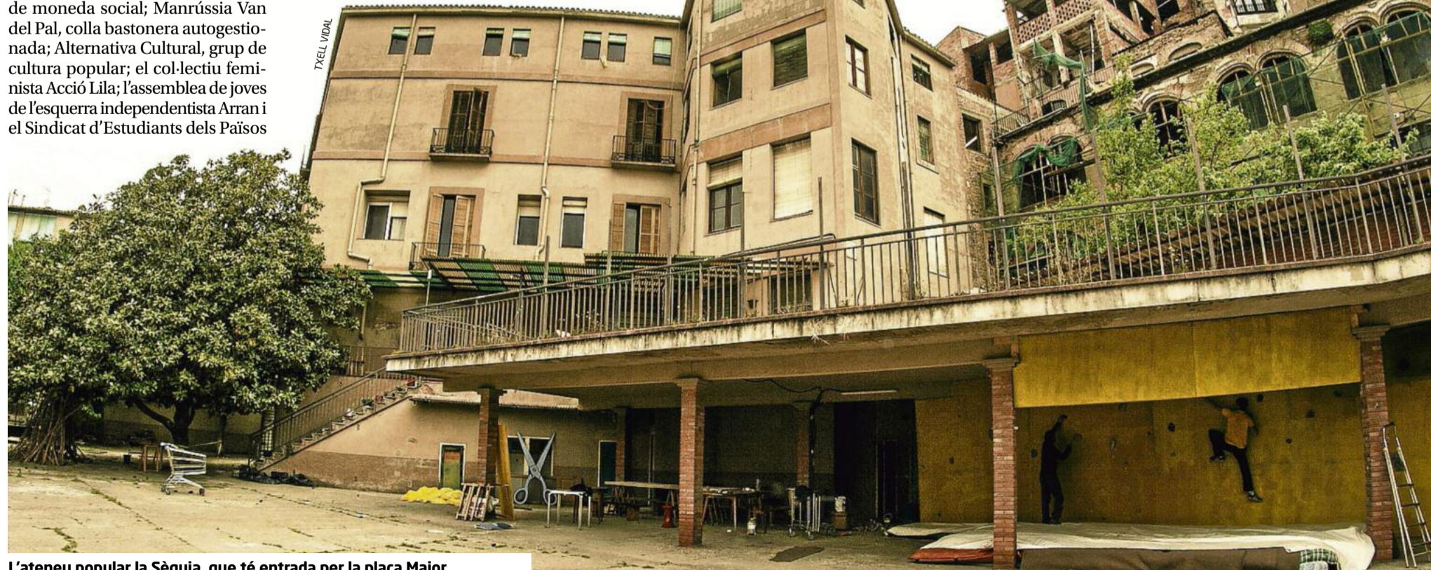
L'ateneu popular la Sèquia, que té entrada per la plaça Major

Per tal de presentar-se i fer explícita la seva voluntat d'obertura a la ciutat, els col·lectius de l'ateneu van gravar un lipdub el dia 13 d'abril a ritme d'una cançó del grup bagenc Kòdul, i és un recorregut que va des de la plaça Major fins a l'interior de l'edifici, que acaba a la terrassa. El vídeo, que està penjat a YouTube des d'aquest dilluns, ja supera les 10.000 visites.