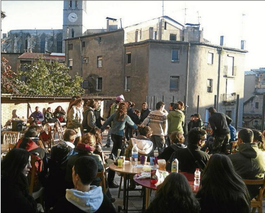
Festa d'inauguració de l'ateneu, el mes de desembre passat